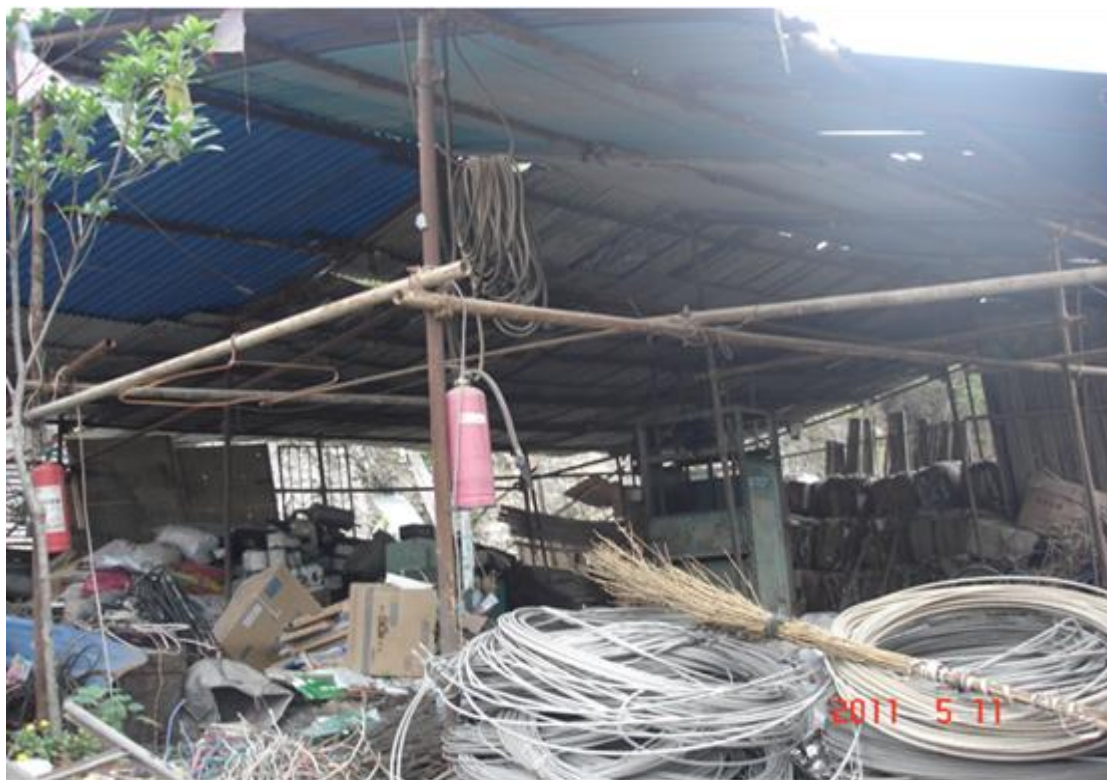
图 2.1 巫山县茂林废旧金属有限责任公司寨子包回收仓库