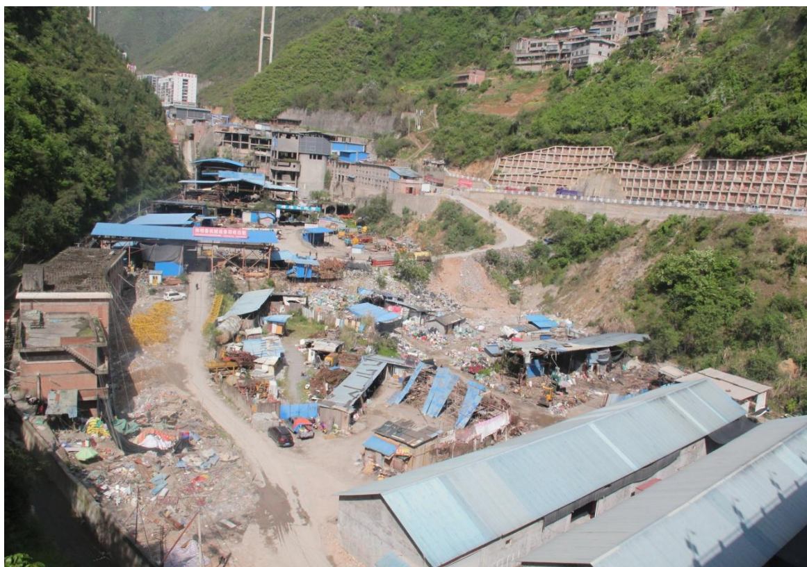
图 2.2 巫山县龙潭沟再生资源回收场所