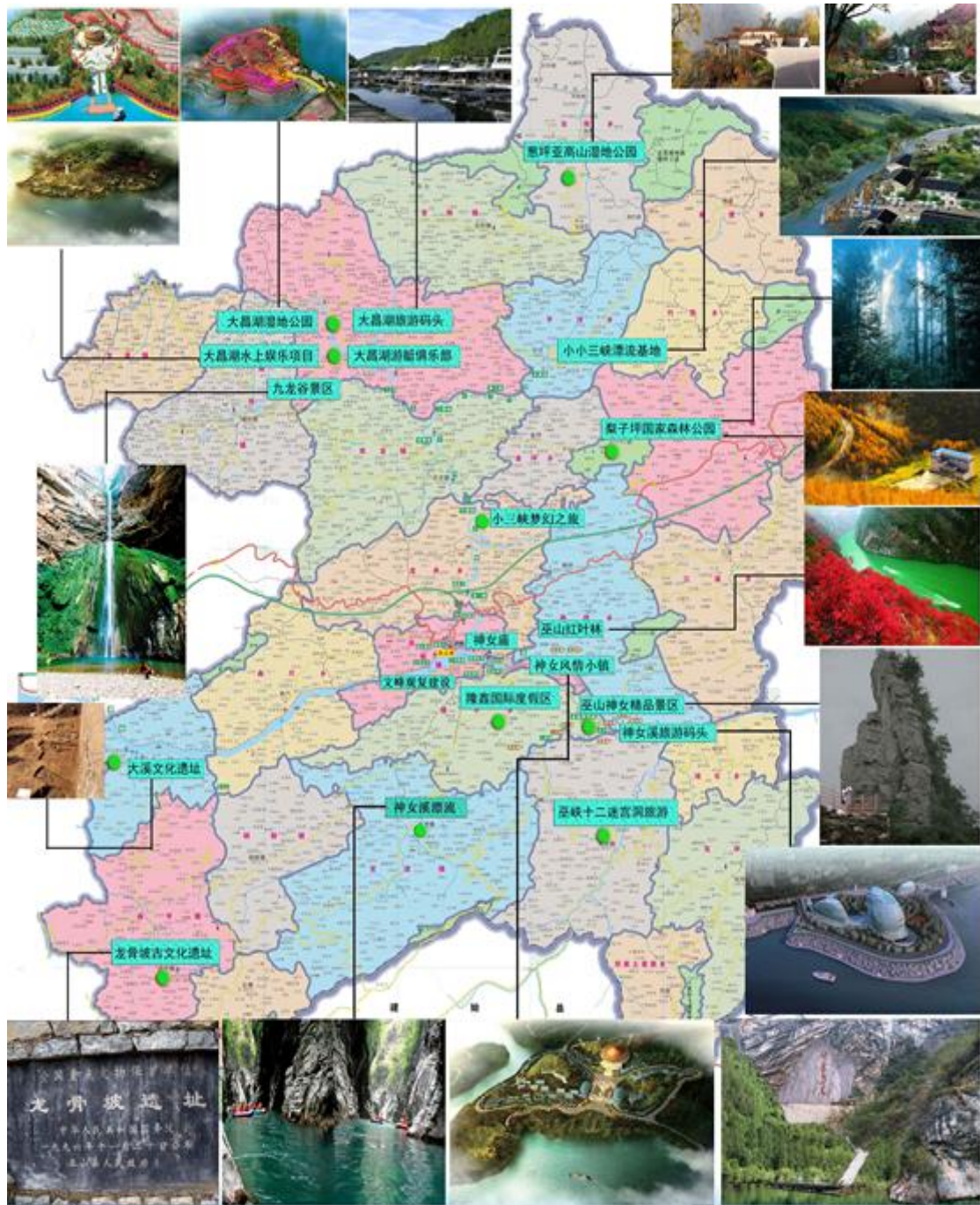
图 1-3 巫山旅游景点分布图

2019年成功创建首批国家全域旅游示范区，大昌湖成功创建国家湿地公园，小三峡景区通过文化旅游部5A级景区评定性复核，小三峡景区获重庆市绿色景区。加强再生资源回收利用，是保护好旅游环境、发展旅游第一支柱产业的重要保障。